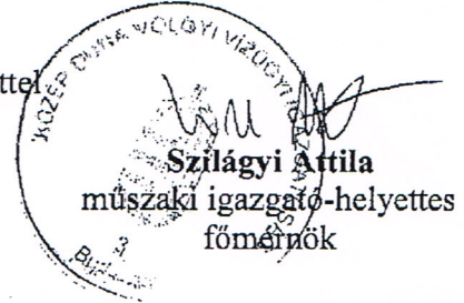
Szilágyi Ártilla műszaki igazgató-helyettes főmérnök